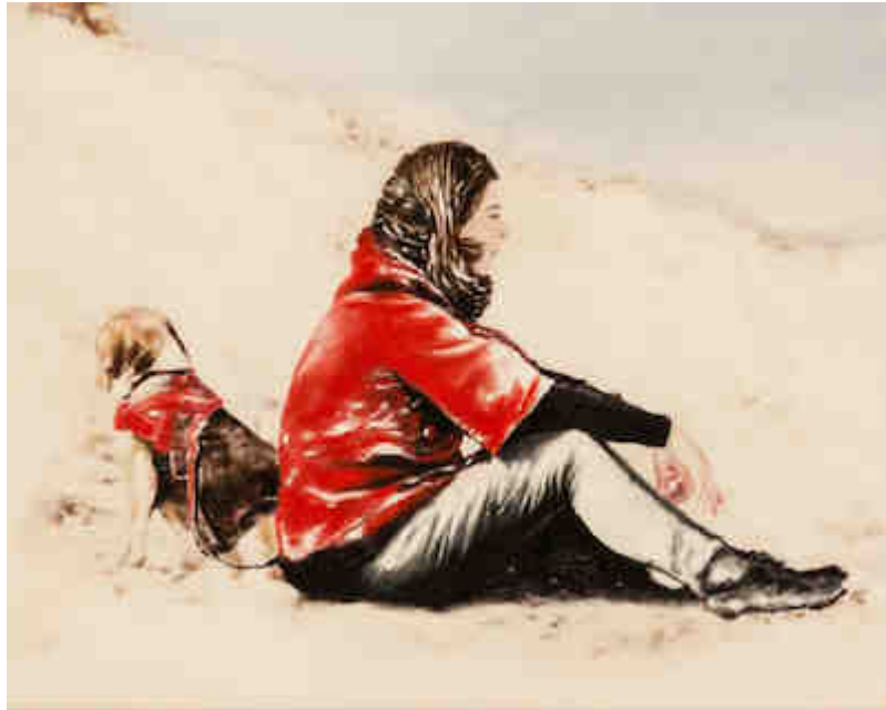
Ficus – acrilico su tela 66×50 cm collezione privata

Allo stesso modo, Tommaso Chiappa nei quindici dipinti inediti ripercorre un itinerario attraverso tredici luoghi di Palermo. Il Grand tour dell'artista non consiste soltanto nell'osservare i luoghi più caratteristici della città, ma anche nel provare a meditare su alcuni concetti sociali. E trasformare la pittura in una lente di ingrandimento per osservare la realtà.